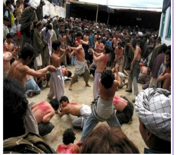
ஷீஆக்களின் காமலீலை வெறியாட்டம்