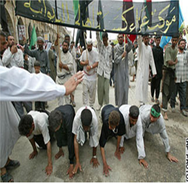
இந்து மதத்தையும் மிஞ்சிய கலாச்சார நடைமுறைகள்