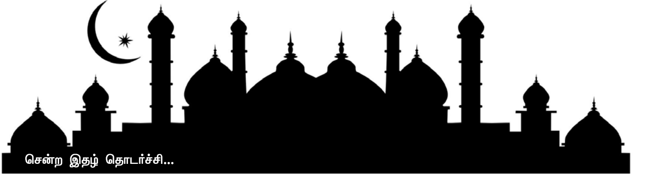
சென்ற இதழ் தொடர்ச்சி...