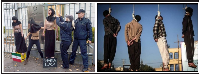
சுன்னா முஸ்லிம்கள் தூக்கிலிடப்படும் காட்சி

நவீன காலத்தில் சுன்னா இளைஞர்களுக்கு எதிராகவும் அங்கு வாழும் புத்திஜீவிகள், கல்விமான்களுக்கு எதிராகவும் ஈரான் நாளாந்தம் அரங்கேற்றி வரும் கொடுமைகள் பற்றி ஈரானுக்காக வரிந்து கட்டிக் கொண்டு நிற்கும் சமூகவலைத்தளப் போராளிகளிடம் எவ்வாறான புதில்களை எதிர்பார்க்கலாம்.